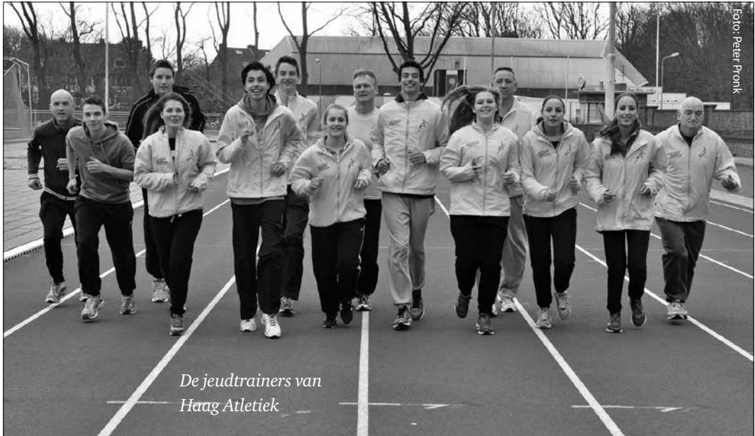
De jeudtrainers van Haag Atletiek